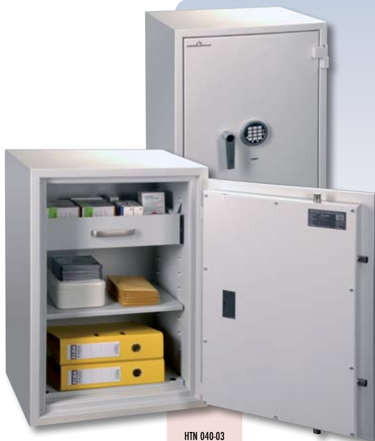
zdjęcie przedstawia wyposażenie specjalne